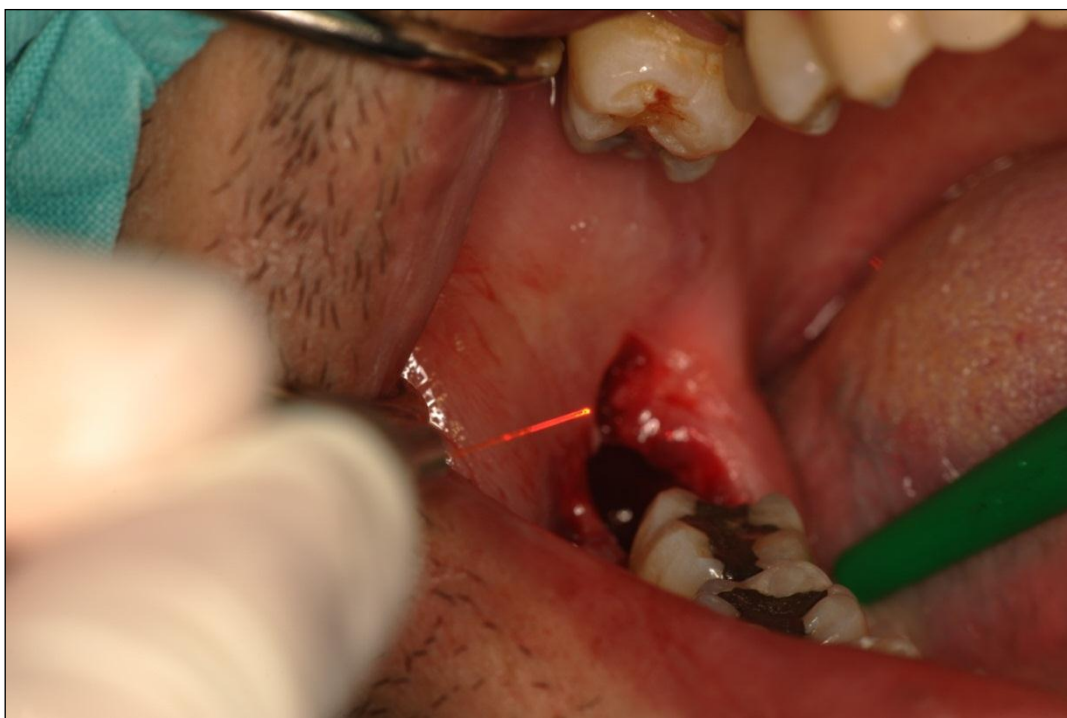
Slika 18. Terapija postekstrakcijske alveole a-PDT (the antimicrobial Photodynamic Therapy) laserskom terapijom tijekom 60 sekundi (ispitanik iz skupine P1-fotodinamska skupina)