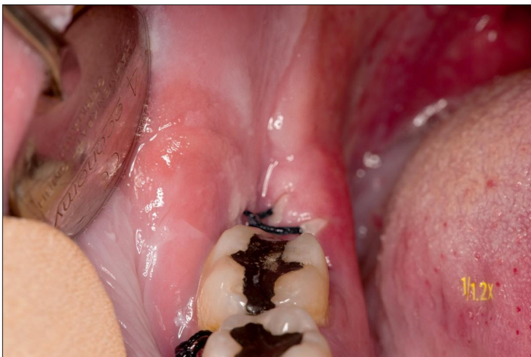
Slika 20. Izgled rane trećeg postoperativnog dana (ispitanik iz skupine P1-fotodinamska skupina)