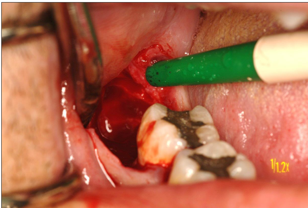
Slika 15. Postekstrakcijska alveola desnog impaktiranog umnjaka ispitanika iz skupine P1 (fotodinamska skupina)