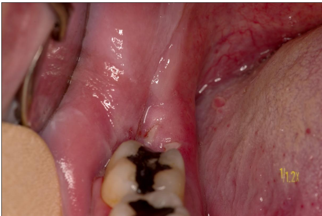
Slika 21. Izgled rane sedmog postoperativnog dana, nakon uklanjanja šavova (ispitanik iz skupine P1-fotodinamska skupina)