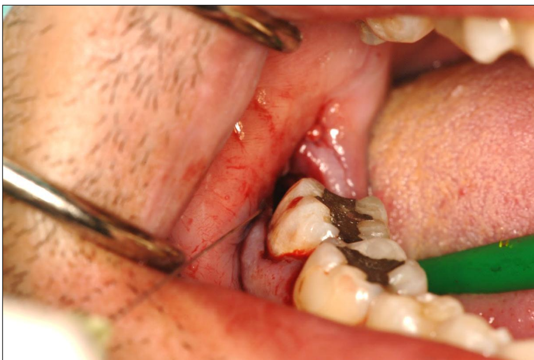
Slika 16. Aplikacija Paro-PDT otopine u u postekstrakcijsku alveolu tijekom 60 sekundi (ispitanik iz skupine P1-fotodinamska skupina)