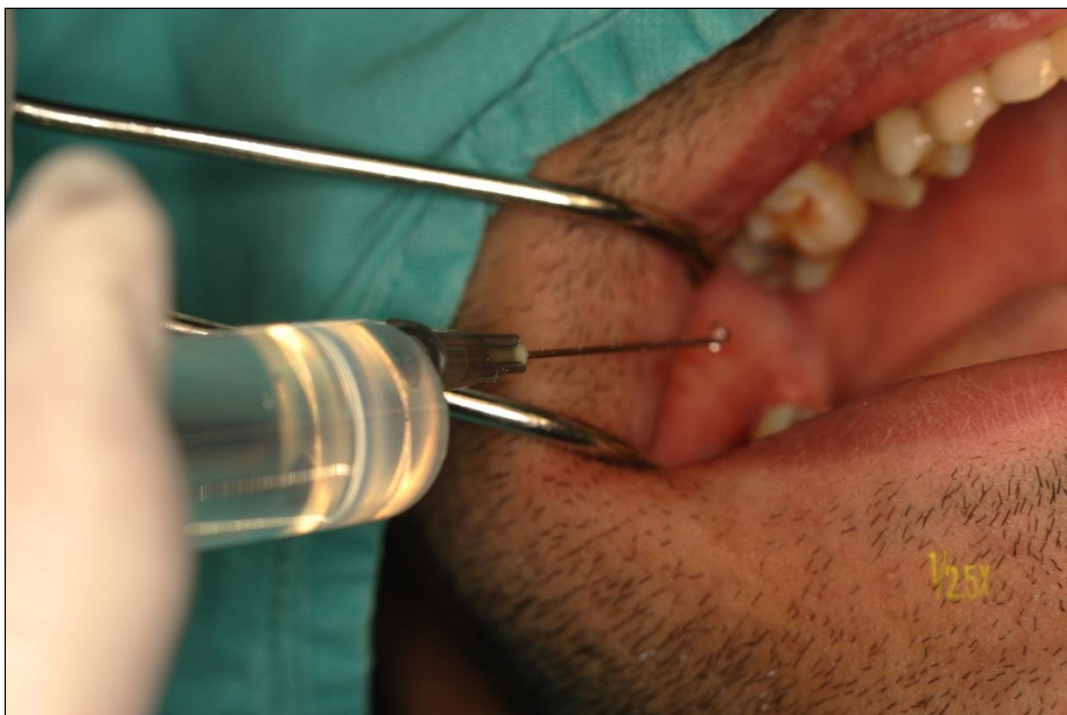
Slika 17. Ispiranje Paro - PDT otopine a iz postekstrakcijske alveole fiziološkom otopinom (ispitanik iz skupine P1-fotodinamska skupina)